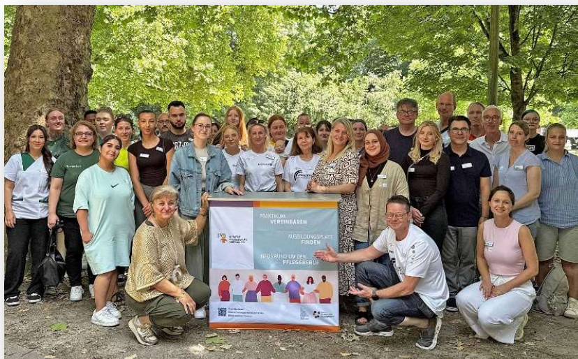
Mitglieder der IPO bei der Berufsfelderkundung „IPO-Zukunftsevent“ 2025 im Umlandpark

Wie in den vergangenen Jahren findet auch 2026 wieder das "IPO-Zukunftsevent" der Initiative Pflegeberufe Oberhausen, im Umlandpark in Oberhausen (Umlandstraße 35, 46047 Oberhausen) statt. Das Event kann als Berufsfelderkundungstag genutzt werden.