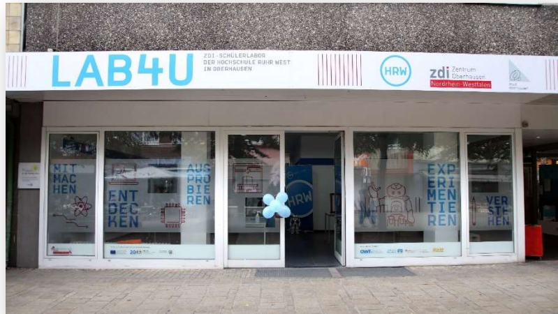
LAB4U an der Marktstraße 148 in Oberhausen

Zwischen 16:00 und 18:00 Uhr besteht die Gelegenheit, mit dem mint4u-Team ins Gespräch zu kommen und sich zu vernetzen.