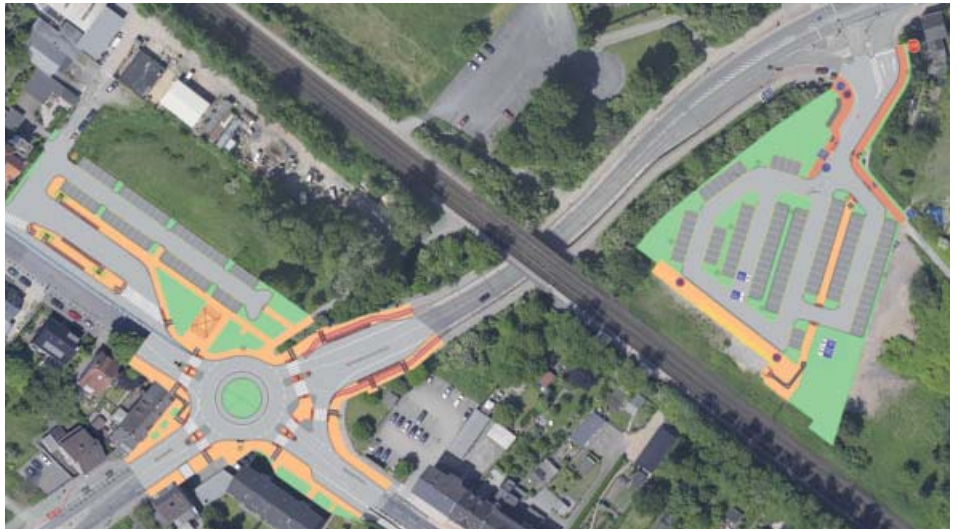
Die Planungen für den Kreisverkehr und den Park + Ride-Parkplatz im Überblick

Der Kreisverkehr wird in zwei Teilstücken gebaut, um auf eine Vollsperrung