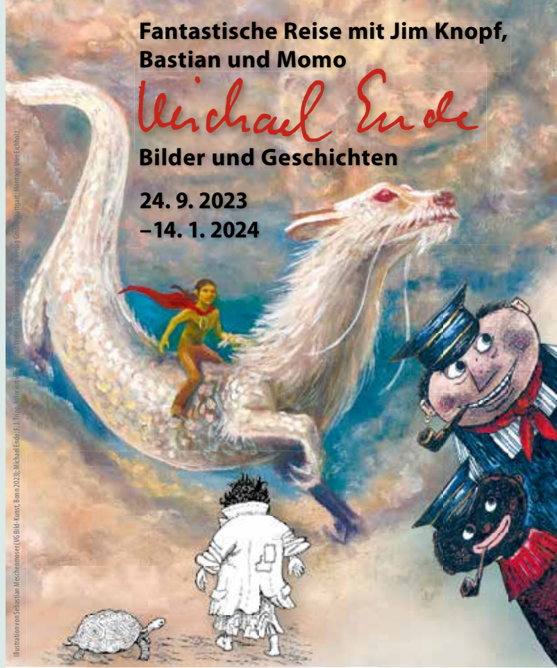
Illustration von Sebastian Meckemrose (VG Bild-Kunst, Bonn 2023); Michael Ende, E.J. Rapin, Autor*innen: ...