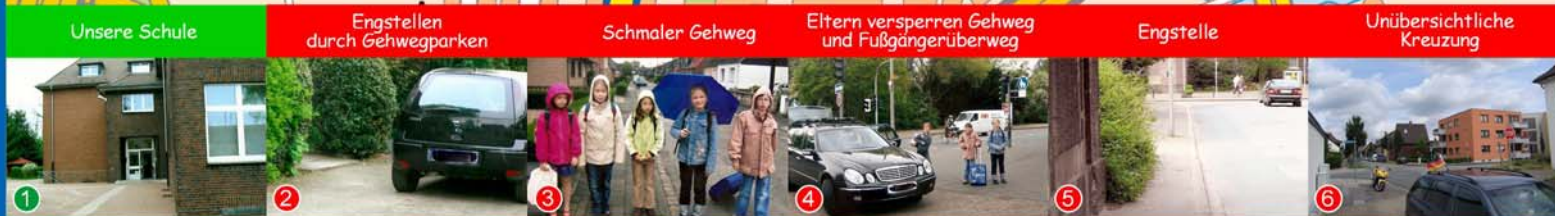
1 Unsere Schule 2 Engstellen durch Gehwegparken 3 Schmaler Gehweg 4 Eltern versperren Gehweg und Fußgängerüberweg 5 Engstelle 6 Unübersichtliche Kreuzung