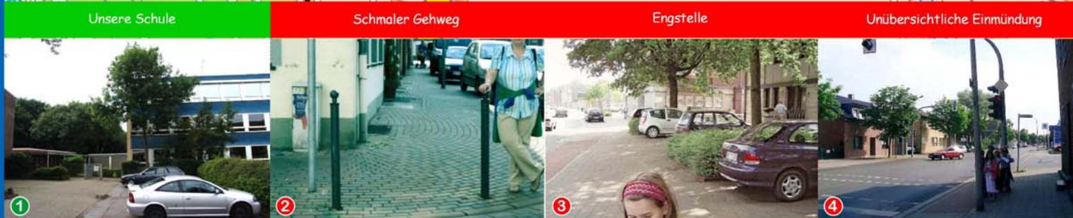
1 Unsere Schule 2 Schmaler Gehweg 3 Engstelle 4 Unübersichtliche Einmündung