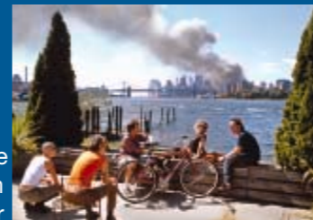
Thomas Hoepker, Blick von Williamsburg, Brooklyn, auf Manhattan, 11. Sept. 2001

„Schnipseljagd und Farbenschlacht nicht nur für kleine Glühwürmchen“ heißt hier das Motto. Das von der Malschule entwickelte Mitmach-Fest wendet sich besonders an Familien. Ab 18 Uhr erklingen imposante japanische Taiko-Trommeln von Shakti Utaiko und ihrer Trommlergruppe.